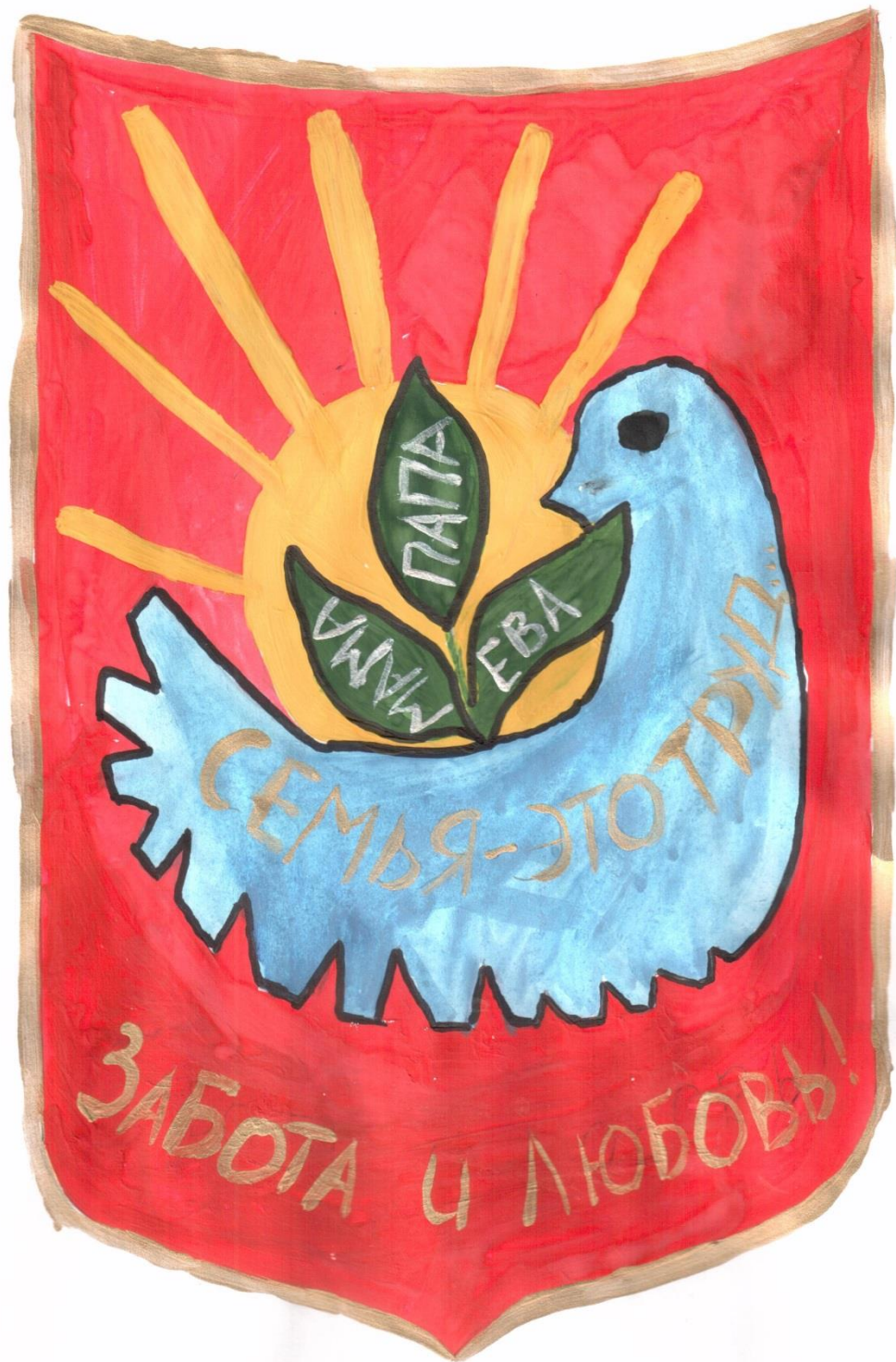
Бринюк Ева, 5 лет