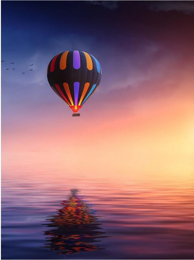
Фото с правой или левой стороны, здесь можно добавить очень короткий текст.

ИСПОЛЬЗУЙТЕ КАЧЕСТВЕННЫЕ ЗАХВАТЫВАЮЩИЕ ФОТОГРАФИИ, КОТОРЫЕ ПРИВЛЕКАЮТ ВНИМАНИЕ.